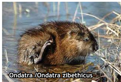
Ondatra / Ondatra zibethicus

A mfibienii sunt prezenți prin speciile: broasca mare de lac ( Rana ridibundus ), broasca mică de lac ( Rana esculenta ), tritonul crestă ( Triturus cristatus ),