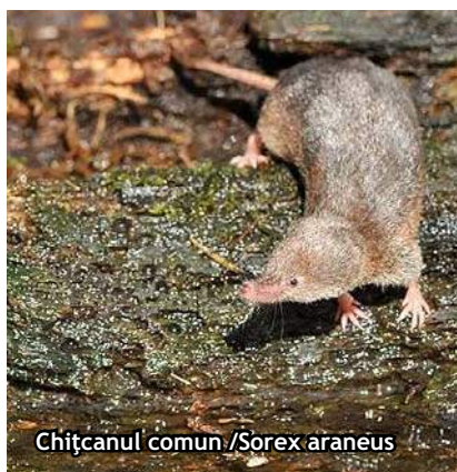
Chițcanul comun / Sorex araneus

( Plantago major ), narrowleaf plantain ( Plantago lanceolata ), clover ( Trifolium ), meadow foxtail ( Alopecurus pratensis ), redtop ( Agrostis alba ), orchard grass ( Dactylis glomerata ), bird's-foot trefoil ( Lotus corniculatus ), perennial rye grass ( Lolium perenne ), smooth meadow-grass ( Poa pratensis ), common vetch ( Vicia sativa ), bird's-eye speedwell ( Veronica chamaedrys ), lungwort ( Pulmonaria officinalis ). The fauna is particularly represented by insectivorous mammals like hedgehog ( Erinaceus europaeus ), European mole ( Talpa europaea ) and by rodents such as common shrew ( Sorex araneus ), pygmy shrew ( Sorex minutus ), common vole ( Microtus arvalis ). Sometimes the European hare ( Lepus europaeus ) can be seen there too. The birds world is represented by crested lark ( Galerida cristata ), Eurasian skylark ( Alauda arvensis ), corn bunting ( Miliaria calandra ), common quail ( Coturnix coturnix ), white wagtail ( Motacilla alba ), European stonechat ( Saxicola torquata ), common blackbird ( Turdus merula ), song thrush ( Turdus philomelos ), greenfinch ( Carduelis chloris ), leaf warbler ( Phylloscopus ), etc.